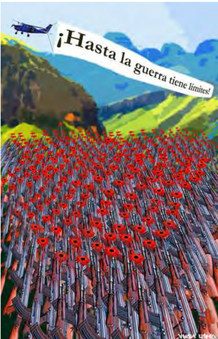
• Premio nacional de diseño Calendario CICR 2012.