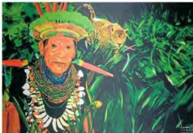
Esta obra hace parte de la serie Tributos a lo ancestral.

Esta colección está conformada por 20 obras que están distribuidas en tres series: Sabiduría ancestral , Misticismo natural y Vida en la calle . "En la primera se muestra más que todo las culturas aborige-