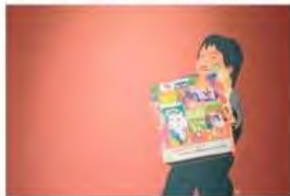
Una muestra de lo que trae la serie Vida en la calle.