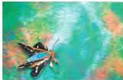
Esta pieza integra la serie Mística natural.

diseñador visual, pero ahora se enfocó en el arte, en especial en la pintura, y hoy (6:30 p.m.) exhibe su primera exposición en la Pinacoteca del Palacio de Bellas Artes denominada De lo ancestral a lo contemporáneo .