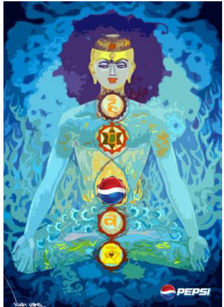
• Premio mundial de diseño Pepsi Calendar 2012.