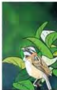
Otra de la serie Mística natural: En ella la imagen al afrechar.

más contemporáneas debido a que el software que se usa para pintar ha evolucionado en los últimos años, pues inicialmente se podía dibujar o pintar a través de códigos, pero hoy todo se puede hacer con un lápiz óptico y el que utilizo tiene 11 millones de precisiones que emulan a la perfección la mano, entonces las técnicas que usamos óleo y acrílico digital".